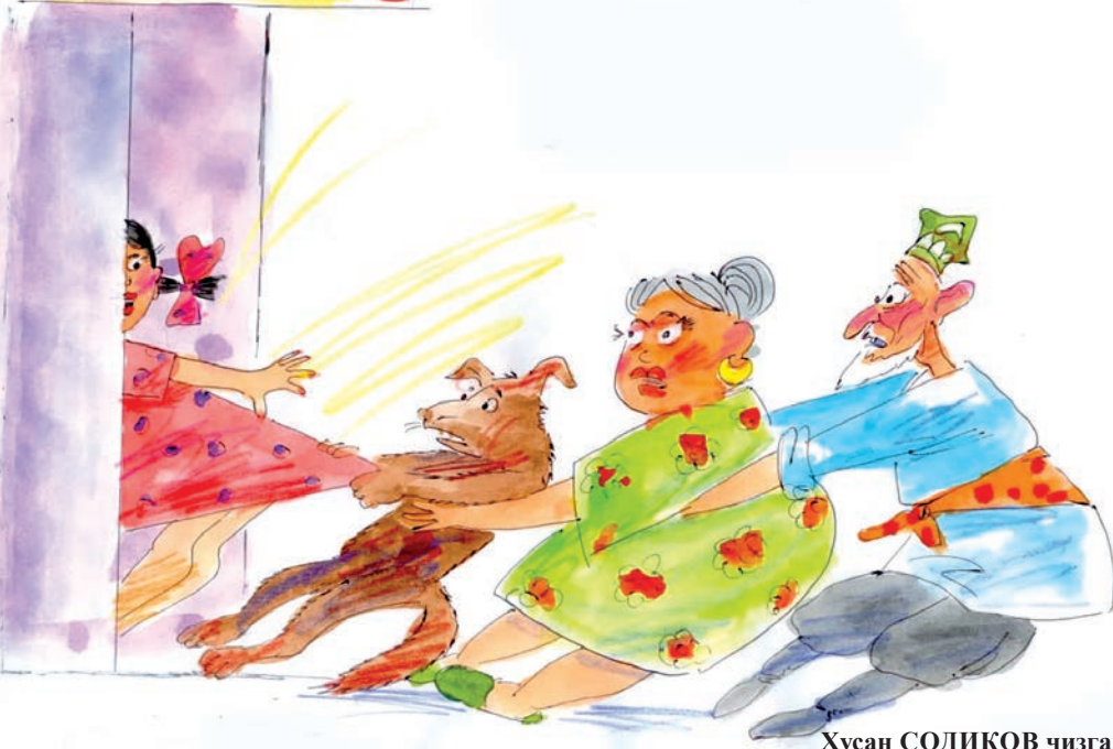
Хусан СОДИҚОВ чизган карикатура.