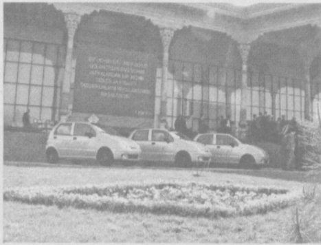
«Ташаббус — 2009»

ПРЕЗИДЕНТИМИЗ ИСЛОМ ҚАРИМОВНИНГ 2008 ЙИЛДА МАМЛАКАТИМИЗНИ ИЖТИМОЙ-ИҚТИСОДИЙ РИВОЖЛАНТИРИШ ЯКУНЛАРИ ВА 2009 ЙИЛГА МЎЛЖАЛЛАНГАН ИҚТИСОДИЙ ДАСТУРНИНГ ЭНГ МУҲИМ УСТУВОР ЙЎНАЛИШЛАРИГА БАҒИШЛАНГАН ВАЗИРЛАР МАҲКАМАСИ МАЖЛИСИДАГИ МАЪРУЗАСИДА ТАДБИРКОРЛИК ҲАРАКАТИНИ БАРҚАРОР РИВОЖЛАНТИРИШ МАСАЛАСИГА АЛОҲИДА ЭЪТИБОР ҚАРАТИЛДИ. БУНИНГ УЧУН БАРЧА ЗАРУР ШАРТ-ШАРОИТЛАР ЯРАТИЛГАН.