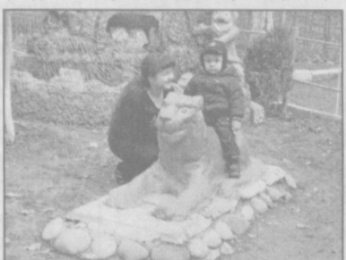
либ тасдиқланган. Ҳозирда шу асосда иш олиб борилапти.

Шуни алоҳида таъкидлаш жоизки, янги ташкил этилаётган ширкатларга раҳбарлар сайлови демократик асосда ўтказиб келинапти. Ҳар бир ширкат учун уй ва кириш йўлакларини таъмирлаш, ертўла ва ирригация шохобчаларини тозалаш, йўлак майдонлари ва ертўлаларга ёритиш ускуналари ўрнатиш бўйича жадваллар ишлаб чиқи-