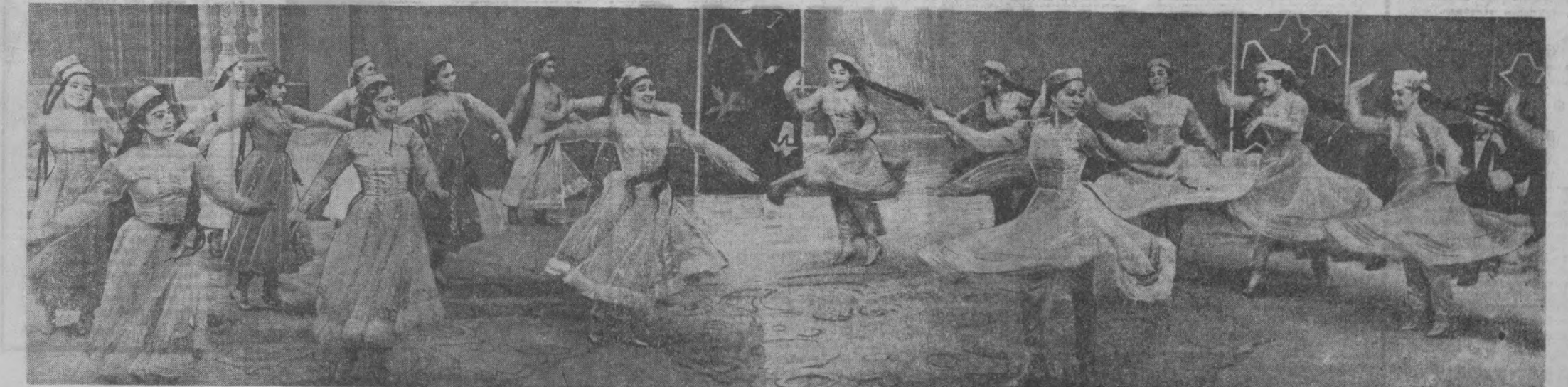
ДИЛЛАРДА БАҲОР, ЭЛ-ЮРТДА БАҲОРИ