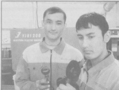
«Ташаббус — 2009» совриндорлари

Бугунги бозор иқтисодиёти шароитида «тадбиркорман» деб қўл қовуштириб ўтириш фойда келтирмайди. Балки ташаббус кўрсатиш, тинмай изланиш, яратилаётган имкониятлардан оқилона фойдаланиш самара беради, муваффақиятларга гаров бўлади.