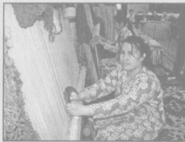
шунтиришлар беришди. Шунингдек, иштирокчиларга бепул қўлланмалар ҳам тарқатилди. Тадбиркорларнинг иш фаолиятини кенгайтириш, қўшимча иш ўринлари яратишларига имкон яратиш учун банклардан кредит олиш мақсадида биринчи чорак мобайнида 24 нафарига бизнес-режалар ишлаб чиқилди.

Мустақилликнинг илк йиллариданоқ мамлакатимизда тадбиркорликка кенг йўл очилиб, ишбилармонларни ҳар томонлама қўллаб-қувватлашга қатта эътибор қаратилгани боис ҳам бугунги кунда уларнинг сафи кенгайиб, иқтисодийнинг ривожидagi ҳиссаси ортди.