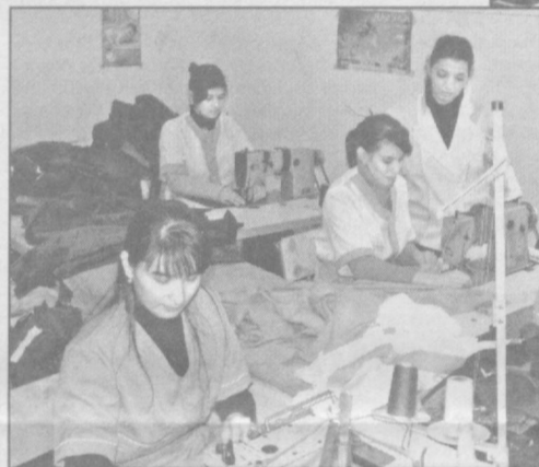
Кичик бизнес ва хусусий тадбиркорлик

Мамлакатимизда йил сайин кичик бизнес ва хусусий тадбиркорлик ривожига катта эътибор қаратилмоқда. Президентимиз таъкидлаб ўтганларидек, кичик бизнес орқали янги-янги иш ўринлари яратилиб, бизнинг шароитимизда иш билан банд аҳоли даромадининг 70 фоиздан ортигини ташкил этмоқда.