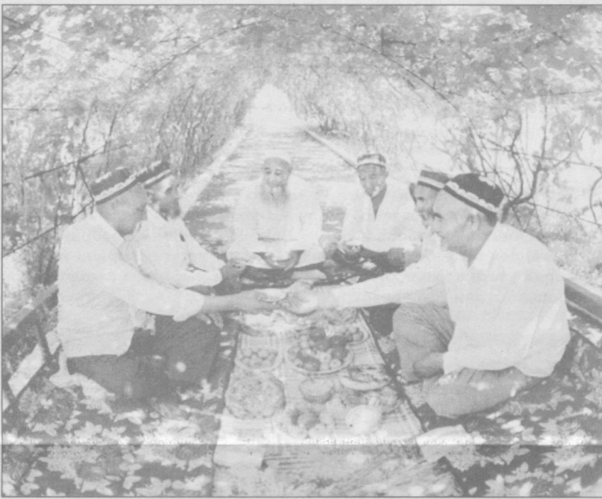
Бир пиёла чой устида

Хуллас, ўлкамизга лайлаклар учиб келишмоқда, қувнайверинг болалар!