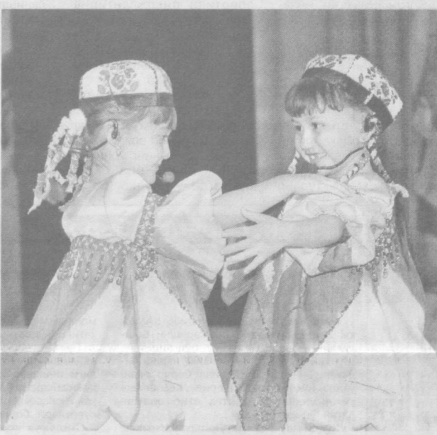
Кел ййнаймиз, дугонажон

Маъжур ноёб ҳолатнинг ҳақиқатлиги тажрибаларда синналган. Одамларга бири табийи ва иккинчиси кўзгудаги тасвирдан олинган икки фотосурат кўрсатилганда, асосан улар кўзгуда кўриб юришга одатланган тасвир ифодаланган суратни афзал кўришган.