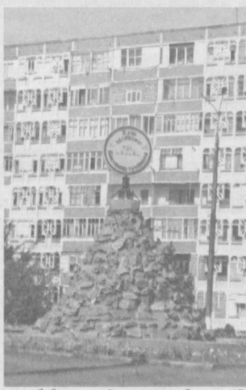
таланиб, болалар майдончаларида барча қўлайликлар яратилмоқда.

Авалло асосий эътибор бунёдкорлик ва обodonлаштириш ишларига қаратилган бўлиб, албатта унинг замирида аҳоли фаровонлиги, турмуш даражасининг ошишига эришиш кўзда тутилган. Байрам арафасида туманда биринчи — Бектемир касб-хунар коллежи қуриб битказилди, «Кўйлик» бозори ёнида 340 ўринли «Савдо мажмуаси» фойдаланишга топширилди. «Бектемир спирт» акциядорлик жамиятининг барча қўлайлиқларига эга бўлган 4 қаватли биноси қайта чирой очди. Шунингдек, 658 та яқка тартибдаги хонадонлар, 185 та кўп қаватли уйлар, 102 та корхона ва ташкилотларнинг фасадлари тазмирланиб, маҳаллалар кўригига кўрк қўшилиди. Айни пайтда эса мазкур вази-фаларнинг ижроси кизгин паллада. Обodonлаштириш юмушларида барча фаол иштирок этмоқда. Кўзланган режадагидан анча ортиқ, яъни 4050 тул турли дархат қўчалари, 112 минг дон рағ-баран гуллар ўтказилди. Бугунги кунгача 22 минг тулдан зиёд дархатларга шакл берилди, 56.200 погон метр сув хобчалари тозаланди. Пойтахтимизнинг 2200 йиллиги арафасида яқунланган «Энг ибратли маҳалла» кўрик-танловида мавҳуд 12 та маҳалла аҳоли фаол иштирок этмоқда. Тумандаги кўп қаватли уйларни бирлаштирган 43 та хусусий уй-жой мулкдорлари ширкати ва 6 та профессионал бошқарув компаниялари ҳам байрам тарадуди, ҳам келгуси мавсум куз-қиш хозирлигини пухта олиб боришда имкониятлардан оқилона фойдаланишмоқда. Кўп қаватли турар жой бинолари ён-атрофлари орас-