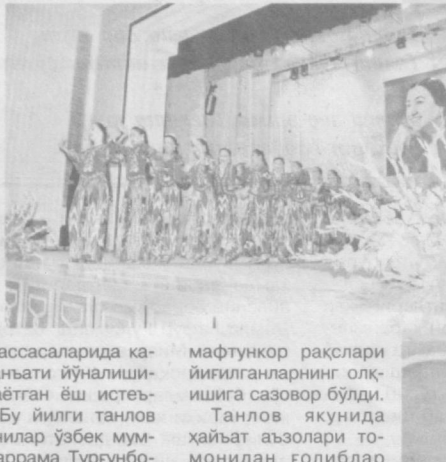
мафтункор рақслари йиғилганларнинг олқишига сазовор бўлди.

мидаги «Ўзбекрақс» миллий рақс бирлашмаси ташаббуси билан Мукаррама Турғунбоева номидаги миллий рақс ижрочилари республика кўрик-танлови бўлиб ўтди. Унда танлов шартларига кўра 18 дан 25 ёшгача бўлган «Ўзбекнаво» эстрада бирлашмаси, «Ўзбекрақс» миллий рақс бирлашмалари, академик ва халқ бадий жамоаларида, санъат ва маданият муассасаларида каммида икки йил рақс санъати йўналишида фаолият олиб бораётган ёш истеъодлар қатнашдилар. Бу йилги танлов шартига кўра иштирокчилар ўзбек мунтоз рақс усталари Мукаррама Турғунбоева, Исохор Оқилов, Галия Измайлова, Кундуз Мирқаримова, Розия Каримова, Юлдаз Исмаилова, Олим Комилов ва бошқа устоз санъаткорлар сахналаштирган ёки ижро этган асарлари ҳамда ўзбек миллий рақс санъати аънавалари, бугунги кун ижодидаги рақсларни ижро этиб, ҳайъат аъзолари томонидан муносиб баҳо олдилар. Иштирокчиларнинг жозибали,