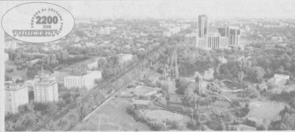
Мозий садо берар турли номлардан, Бинкатми, Чочми ё Мадинат уш Шош. Йўлин йўқотганга йўл бердинг доим,