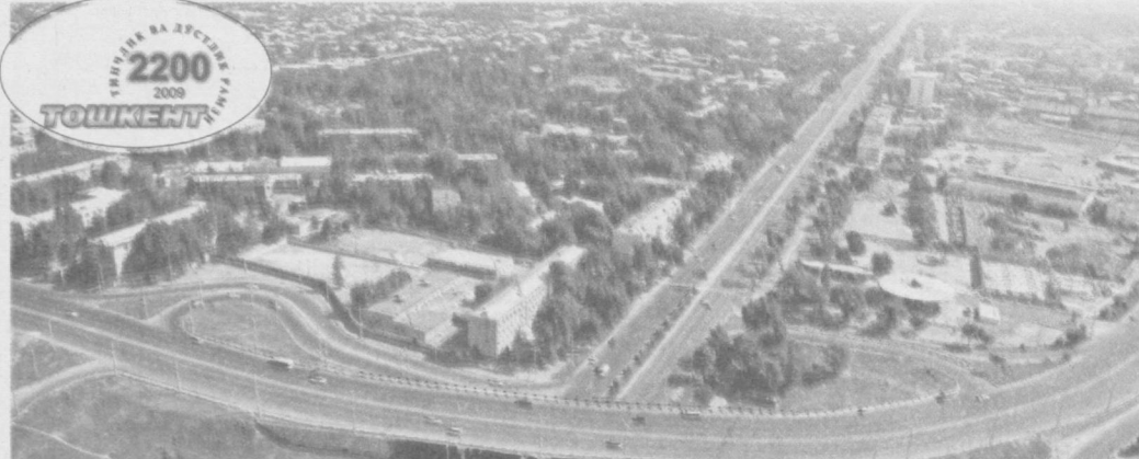
Тошкентим-бошкентим баридан пешдир, Бугун ичим тўла шеър-достон шаҳрим, Жонахон Тошкентим, онахон шаҳрим.

05.55 Курсувалар дастури. 06.00 «Ассалом, Ўзбекистон!».