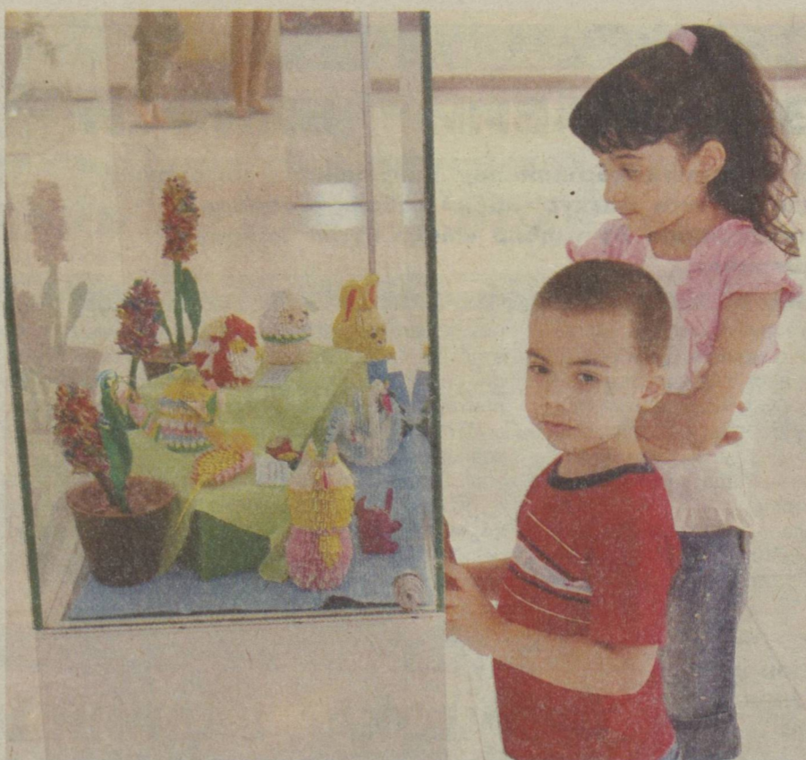
СУРАТДА: кўргазмадан лавҳа.