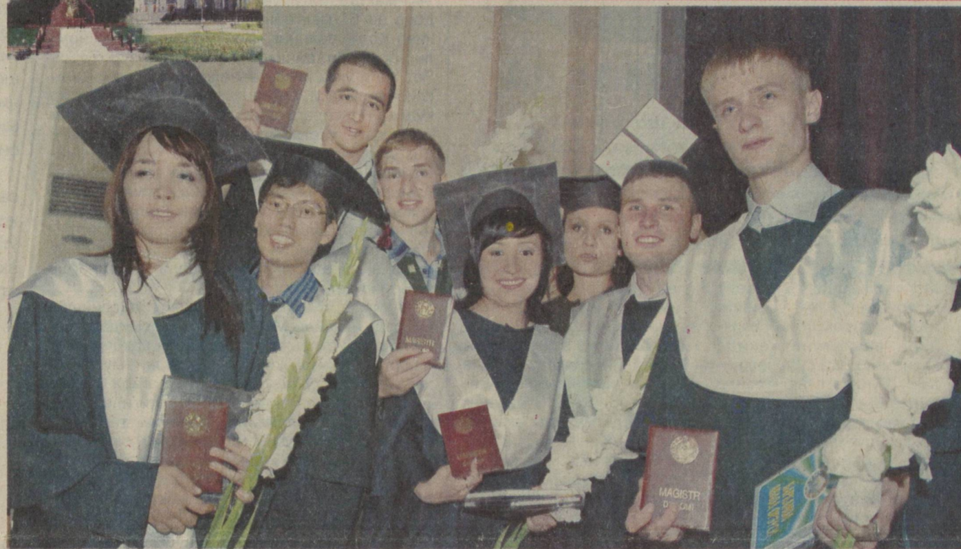
Ёшлар — келажгимиз