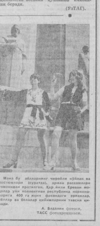
Мана бу абалларнинг чиройли қўйил-ган нустюмлари (суратда), арман расмалари томонидан яратилган. Хар йили Ерван мо-далар уйи коллективи республика норхона-ларига 400 га яқин фасондаги ёрқалар, аб-лар ва болалар кийимларини тавсия қи-лади.