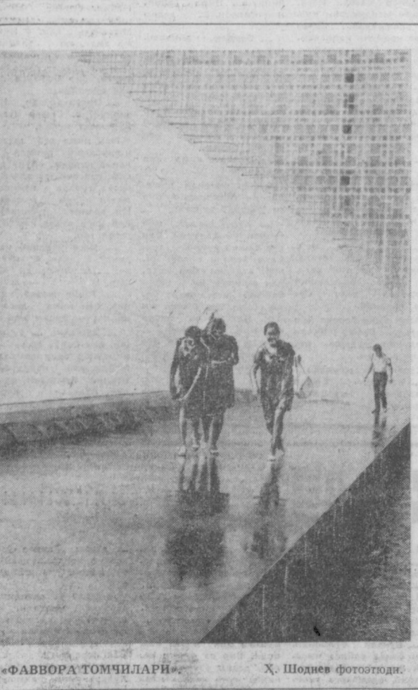
«ФАВВОРА ТОМЧИЛАРИ».

Эраимиздан миллион йил аввал — ТЕЪТМАН номли; Онтарио бундаги саргузаштлар — «РАКЕТА»; Уз хоҳиши билан — «ФЕСТИВАЛЬ»; Исроали киз — «ХИВА»; Россия салтанатининг томи — КИРОВ номли.