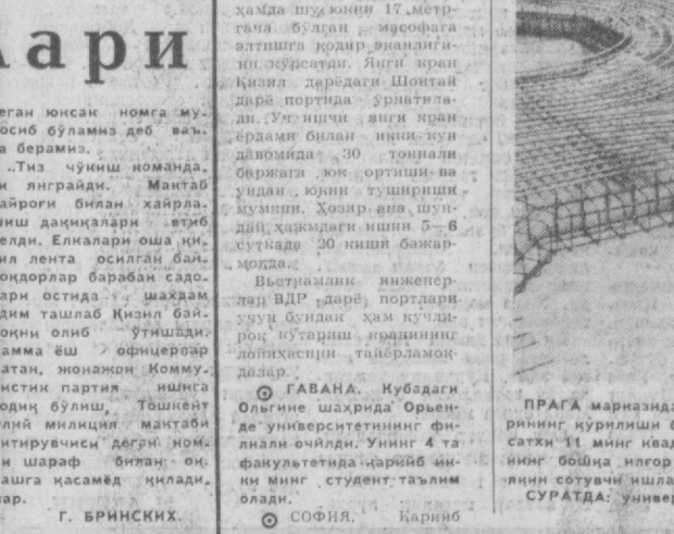
ПРАГА марказида мамлакатда энг йирик универсал магазинлардан бирининг қурилиши бошлаб юборилди. Етти қаватли магазиннинг фойдали сатхи 11 минг квадрат метрни ташкил этади, ўзига хизмат ва савдо йилин бошқа илгор усуллари жорий этилишига қарамай, бу ерда минг йилин сотувчи шийлади. СУРАТДА: универсал магазин қурилишида.

дирим миллион кишини бирлаштирган бадий ҳаваскорларнинг салкам 15 минг коллективни Болгария шаҳар ва қишлоқларида концерт бермоқда. Булар бадий ҳаваскорлик коллективлари ва ансамбллари 65 минг концерт бердилар. ЛОНДОН. 1969 йил августидан бери Шимол Ирландиядаги туҳанаулар унинг қисмида 354 йилдан ўтди, дейилади хунаутнинг бу ерда эълон қилинган донада. Сўнги 12 ой мобайлида Олстердаги Британия ҳарбий мақомида 1500 га яқин ирландияликнинг «террорчилик ҳаракати»да аъло баҳо бўлиб ҳам шу доқлаҳда айтылган. Уларнинг кўпчилиги католик бўлибди.