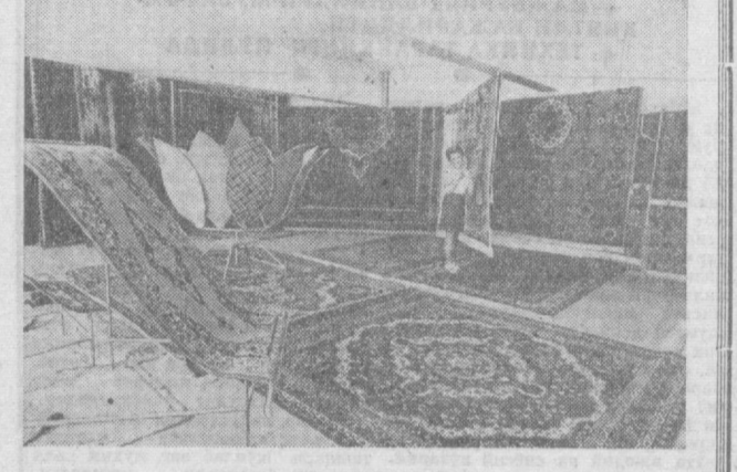
РУМИНИЯ. Чиснеэде шахридаги фабрика усталарининг моҳир кўллари билан тўзилган гиламлар учун қуёқ бўёқ ва оргинал миллий безаклар характерли. Бу гиламлар мамлакат ичкарисиди ҳам, чет элларда ҳам юксак баҳоланади.

БУЭНОС-АЙРЕС. Ар. гентина Кубага 200 миллион доллар миқдорида қарз берди. Бу пулдан тракторлар, юк машиналари, кишлоқ хўжалигини ривожлантиришга ва бошқа мақсадларга йўналтирилади. Бу ҳақда Аргентина молия министри Хосе Хельбард хабар қилди. Қарз берилганлиги — иқтисодий сисбат, деб таъкидлади министр. 11 савдо-сотиқ масалалари тинланганлигидан сўнг улар томонидан имзо қилинган мақсадли қарз берилди. Хосе-Хельбард матбуот конференциясида нутқ сўзлаб, Аргентина