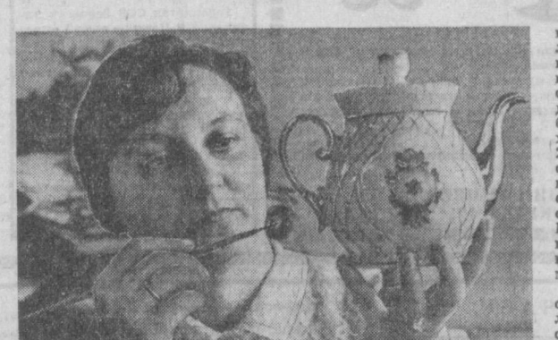
Суми чини заводи кең истеъмол буюм-лари ишлаб чиқариши-ни кўпайтиришга қолмай, унинг са-фатини яхшиламоқ-да. Шу йилнинг биринчи яримда кор-хона пландан ташқари 237 минг сўмлик мах-сулот реализация қилди. «Эртан» чой сервиси Сифат белги-си билан тақдирланди. Бу — Сифат белгиси-га сазовор бўлган за-воднинг ўн бешинчи маҳсулотидир.

М. СОБИРОВ, қишлоқ хўжалик фанлари кандидати