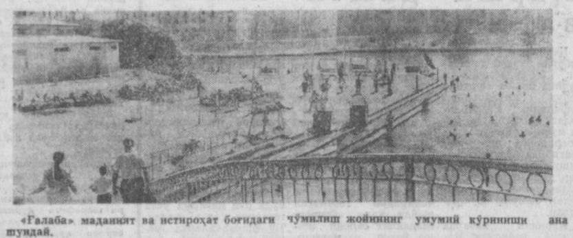
«Галаба» маданият ва истироҳат боғидаги чўмиллик жойининг умумий кўриниши ана шундай.

лаб кириб чиқадиган боғ маъмурияти буни кўрмас?