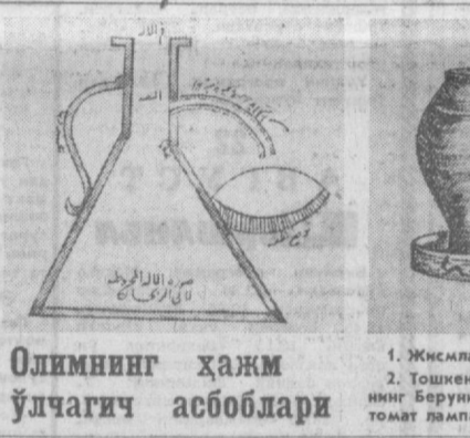
Олимнинг ҳажм ўлчигич асбоблари

чининг ўзи ҳам севиб мақтайдди. Агар ўз саринингизга бўлса ҳам рост гапиринг. *** Пулнинг нотўғри иш- латилиши туфайли ёвуз- лик келтирувчи бойлик юзига келади. *** Зўрлик ва ёлғаш орка- ли амалга ошадиган мажбурий меҳнат до- ми ва туғри эмас. *** Душманлик ва ҳасрат кечиш ҳамма бир текиб бўлгандагина йўқ бўла- ди. *** Менинг бутун фикри- едим, қалбим билан тартиб қилишга қар- ратилган, чунки мен Балки ортинги лаззати- дан баҳраманд бўлиш- дан Бунин мен ўзим учун катта бахт деб ҳисоб- лайман. *** Яхшилик барча одам- ларга баб-баравар, ҳу- сустан, ўз ақлига ях- шилик қилишнинг аниқла- ди: ожиз бўлса яхши орзу-тилкалар билан, кодир бўлганда моддий ёрдамга иятилиш наил қилинади. *** Илмлар кўндир, улар замон ўтиши, иқболни рив- ожига туфайли турли фиқр ва хотирлар кў- чилиши йил кўпаяди. *** Фанларнинг фойдаси улар ёрдамида опти ва кумушларни қўлга ки- ришти эмас, Балки улар туфайли зарур нарсалар- га эришишдир. *** Инсон ҳайвондан ақл билан фарқ қилади. *** Эҳтиёжлар турли-ту- ман ва сон-саноксиздир. Шоақат уларни бир қанча кишилар биргалликда таъминлай олишлари мумкин. Бунинг учун кишиларда шахар яратиш зарурияти туғилади. *** Инсоннинг кадр-қис- мати ўз вазифининг эълон даражада бажа- ришдан иборат, шунинг учун ҳам инсоннинг энг асосий вазифи ва ўрин моҳнат билан белгила- нади.