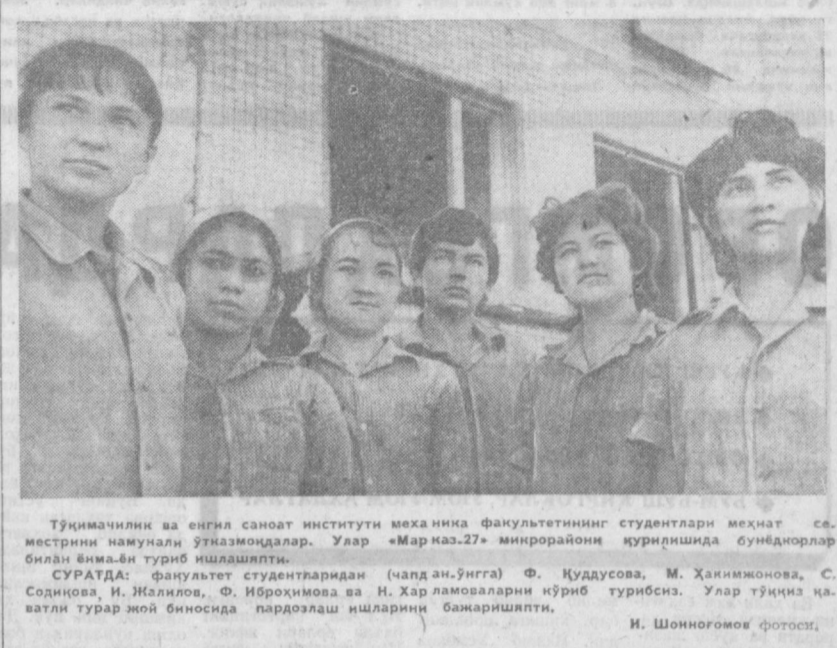
Тўқимачилик ва енгил саноат институтини механика факультетининг студентлари меҳнат семестрини намунали ўтказмоқдалар. Улар «Марказ-27» инкороайон қурилишида бунёдкорлар билан ёнма-ён туриб ишлайпти.

эълон қилганимиз. Бу объектларда Тошкент давлат университети, политехника, тўғимачиллик ҳамда енгил саҳноат институтларининг студент — қурувчилари фидокорлик кўрсатишяпти. Педагогика институтининг студентларидан юз нафарини «500 буюртма» объектлари арасида фойдаланишга талабалари эса, Юнусовод массивида янги Аҳмад Дониш номли «инкороайон» қурилишида 1-ўқувчи комбинати 26-қурилиш бошқармаси бинокорларига кўмаклашмоқдалар. Яқинда Бутуниттифок студент-қурилиш отрядларининг зарбдор меҳнат қуни ўтказилди. Бунда шаҳар студент-қурилиш отрядларидан 2182 таси қатнашиб, 22 миң сўмлик иш бажаришди. Бу маблағнинг 5 миңи 350 сўми Смоленск область Тагарин шаҳридаги ширнерлар лагери қурилиши фондида ўтказилди. Шаҳар олий ўқув юртидан студент-қурилиш отрядлари ўрта-