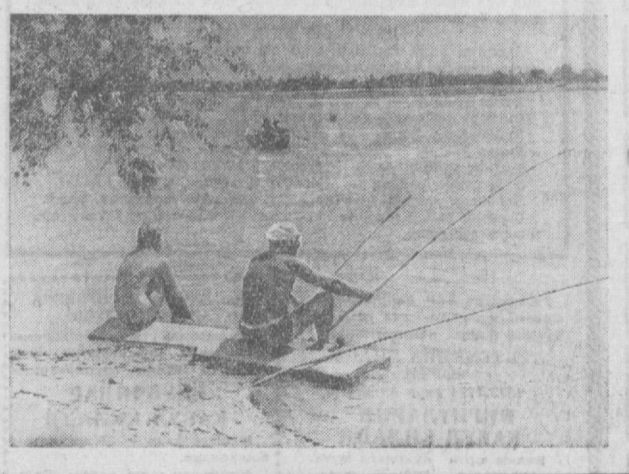
«Роҳат» кўлида балиқчи.

вақти-вақтида ювиш, лозим. Каттароқ уй ўсимликларига пуригачидан ёки маъда кўз жуғуртки лебидан, илчқим ўсимликларга эса пульверизатордан сув сепадилар. Ўсимлик барглари қандай усул билан ювилмасин, уларга дастлаб сув пуриш керак, чунини бунда уларга ёпишган чанг яхшилаб ҳўлланиб, тез ювилиб туширилади.