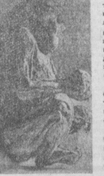
Уратепадан топилиб, музейга берилган антиқа чакалоқ эди.

ковлаб оладилар. Уч метрлар чамаси чуқурга тушилгач, миң йиллар чиройини тўпурқ бекитиб ётган хазинага дуч келдилар. Ун сақизта уй асбоблари то-