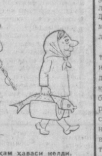
Балиқчининг ҳам ҳаваси иелди.