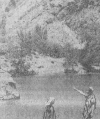
«Тоғлар-ғўзал, дугонажон!» Н. РАҲМОВ ФАТОХУДИ

Тўқин-сочин йиллари консерва таъмирлаш олиб, очарчилиқ йиллари истеъмол қилинса, ёки ёзда гамлаб олинган масаллиқлар қишгача ўзгармай турса қандай яхши! Шу сабабли, 1809 йили Франция ҳукумати пазанда Франсуа Апперга