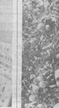
ТАШХИСОВЛАШ ЗАВОДИ ИШЧИЛАРИ

«Ташхисовлаш» заводининг биринчи филиали ишчилари мамлакатимизнинг меҳнатчилари учун «ОВХ-14» маркали пурказичларни қўлаб тайёрлаб бериб, меҳнат соҳасида янги муваффақиятларини қўлга киритиб, Москвага қайтиб келди.