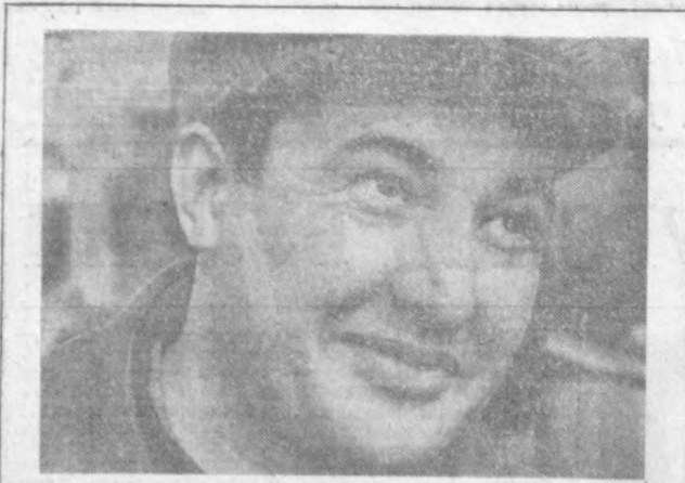
Тошкентдаги «Союзхлопкомаш» бирлашмасининг машинасозлари КПСС XXIV съездининг тархний қарорларидан руҳланиб, маънаватий ҳалқ хўжалиғи учун янада кўпроқ турли хил машиналар комплекси тайёрлаш бўйича бараклам мехнат қилапти.