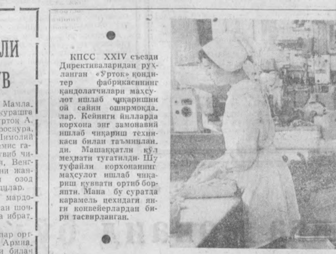
КПСС XXIV съезди Директиваларидан руҳланган «Ўрток» кон- дитер фабрикасининг қандолатчилари маҳсу- лот ишлаб чиқариши ой сайин оширмоқда- лар. Кейинги йилларда корхона энг замонавий ишлаб чиқариш техник- каси билан таъминлан- ди. Машаққатли кўл меҳнати тугатилди. Шу туфайли корхонанинг маҳсулот ишлаб чиқариш қуввати ортиб бора- япти. Мана бу суратда карамель ҳецидаги янги коффейлардан би- ри тасвирланган.

Кўкаламзорлаштириш ишлари нақадар кенг тус олганлигини шундан ҳам билса бўлади- ки, икки ой мобайнида икки миллиондан кўп қўчат ўтказилди.