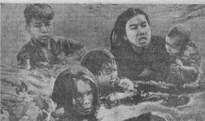
Мана бу фотосуратга бир қаранг. Уни кўрган ҳар бир пок қалбли кишининг вилдони азобла. Икки, Кахрамон Вьетнам халқининг бошга турти азоб унутбатлар келтирган Америка империя, илларига лашналар 3 чий д. Бу фото автори прогрессив Япон журналисти Киюки Савадаки. У етти ой Жабути Вьетнам ва Вьетнам Демократик Республикасининг ҳаракатидаги ҳарбий қисиларида бўлган, Бир неча ўн марта ўлим билан юзмаюз келган. У яратган бу фото Гагада бўлиб ўтган халқаро фотокўргазмада олтин медаль ва бош мунофот — Фахрн диплом билан таъдирланган.

Бултурги йилнинг августидан бир тўда фитначилар контрреволюцион яширин таъшилот билан алоқа боғлаш муаммоларини ағдариб ташлаш мақсади билан бир тўда фитначиларни Занжибар сули Фитначилар Таизаниянинг ўлимга ҳўм қилди. Бу ерда бўлиб ўтган оммавий митингнинг халқ олдига турғазилди. Митингда фитна қатнашчилари, матчиларнинг хушерлиги шуниингдек уларнинг фитначилик фаолиятини исбот қилувчи қуруллар ва бошқа ашёвий далиллар кўрсатилди.