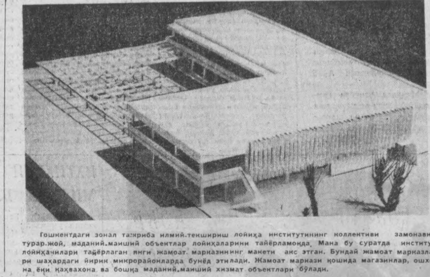
Тошкентдаги зонал тажриба илмий-таълимий институтининг коллективий замонавий турар-жой, маданий, маънавий объектлар лойиҳаларини тайёрламоқда. Мана бу суратда институт лойиҳачилари таёрлаган янги жамоат марказининг макети акс этган. Бундай жамоат маркази, янги шаҳардаги йирик микрорайонларда бунёд этилади. Жамоат маркази ҳолида магазинлар, ошхона, ёни қаҳвахона ва бошқа маданий, маънавий хизмат объектлари бўлади.

1-Тошкент троллейбус депосидан янги автомат мослама ўрнатилган троллейбус 1-маршрут бўлиб йўлга чиқди. Бу автомат мослама Тошкент соғети номидати вагон-ремонт заводидан тайёрланди.