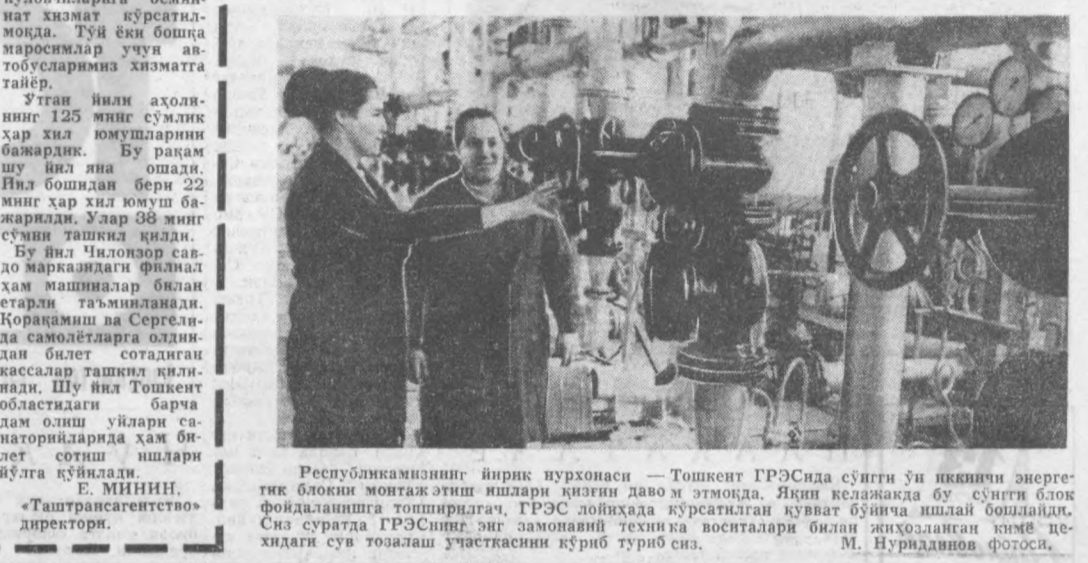
Республикамизнинг йирик пурхонаси — Тошкент ГРЭСида сўнгги ўн йиллик энергетик блокнинг монтаж ишлари қилинган давомида. Яқин келажакда бу сўнгги блок фойдаланишга топширилади, ГРЭС лойиҳада қўрилган қувват бўйича ишлаб бېрилади. Сиз суратда ГРЭСнинг энг замонавий техника воситалари билан жиҳозланган кўми цехидаги сув тозалаш участкасининг кўриб туриб сиз.

Халқ истеъмоли буюмлари ишлаб чиқаришни кўпайтириш вазифасини қўриқувчилар бача коллектив аъзолари, ҳар бир ишчиси куч билан муваффақиятли равишдагина амалга ошириш мумкин.