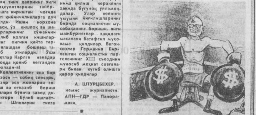
САЙЛОВГА ТАЙЕРМАН. Америкада чиқадиган «Чикаго сан-таймс» газетасидан олинган карикатура.

ГАВАНА. (АПН мухбири). Халқ револуцияси галабасига қадар кубалинлар балет ҳақида фақат эпитардилар. Эндиликда эса у республикада жуда оммалашиб кетди, бу ерда ақойиб раққоса Алисия Алонсо раҳбарлик қилаётган миллий балет томошаларини кўришга борматган.