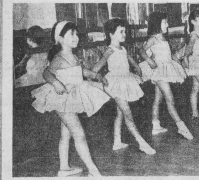
БОЛГАРИЯ. Варнадаги кемазоларнинг маданият уйдаи бир неча йилдан бери балет мактаби ишлаб турибди. Бу ерда таърибади мутахассислар раҳбарлигида 6 ёшдан 15 ёшгача бўлган 130 бола ўқитилапти. СУРАТДА: машғулот пайтида.

НЬЮ-ЙОРК. Автомобиль ва авиация сановати ишчилари бирлашган қасаба союзи ёш аъзоларнинг конференцияси ҳар йили ўтказиб турилади. Уларнинг Чикагода ўтказилган конференцияси Америкадаги ишчиларнинг Вашингтонга умумий миллий юришини бошлашга даъват этди.