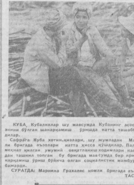
КУБА. Кубалиқлар шу мавсумда Кубанин асосий қишлоқ хўжалик зинин бўлган шакарқамиш ўришда натта ташаббус билан меҳнат қил-дилар.

Варажиндаги тўқимачилик комбинати 55 йилдан бери ишлаб келмоқда. Бироқ тўқимачиларнинг шаҳри ҳам, корхона ҳам мамлакат овоз бўлганидан кейингина гуллаб яш-нади. Бу ерда меҳнат унумдорлиги анча ошди, махсулот ишлаб чиқариши кўпайди. Корхона махсулоти ички бозорда ҳам, шунингдек ташқи бозорда ҳам гоит манзур бўл-моқда. «Вартекс» махсулотининг ярми чет мамлакатларга чиқаришмоқда. Корхонанинг кўпгина гауламалари ва буюмлари халқорави-стиваналарда бир неча бор мукофот ва дипло-матлар билан нотиоланди. Ҳозир комбинатни реконструкция қилиш ишлари қизғин олиб борилмоқда.