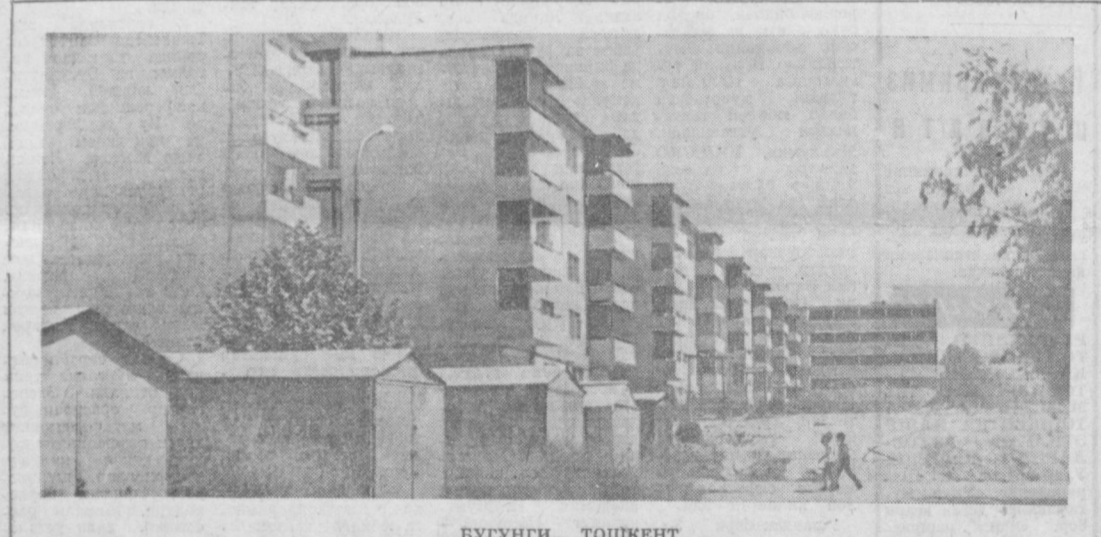
БУГУНГИ ТОШКЕНТ. СУРАТДА: шахримизнинг «Марказ—13» кварталдаги янги мухташам турар жой биноларидан бири.