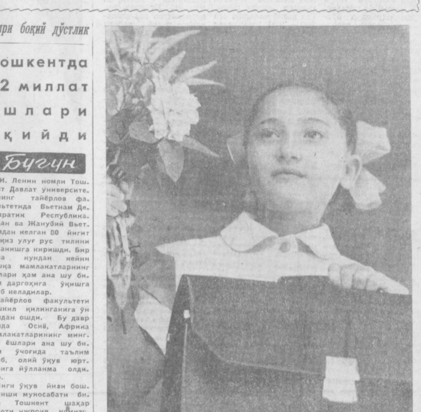
«САЛОМ, ЖОНАЖОН МАКТАБ!»