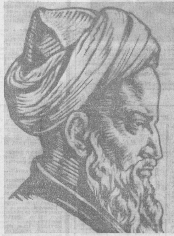
Машриқда қадримни ҳиндлардан сўра, Магрибда —асарим билгандан, жоним!

Э. ҒАЗИЕВ, Шарқшунослик институтининг илмий хозирини.