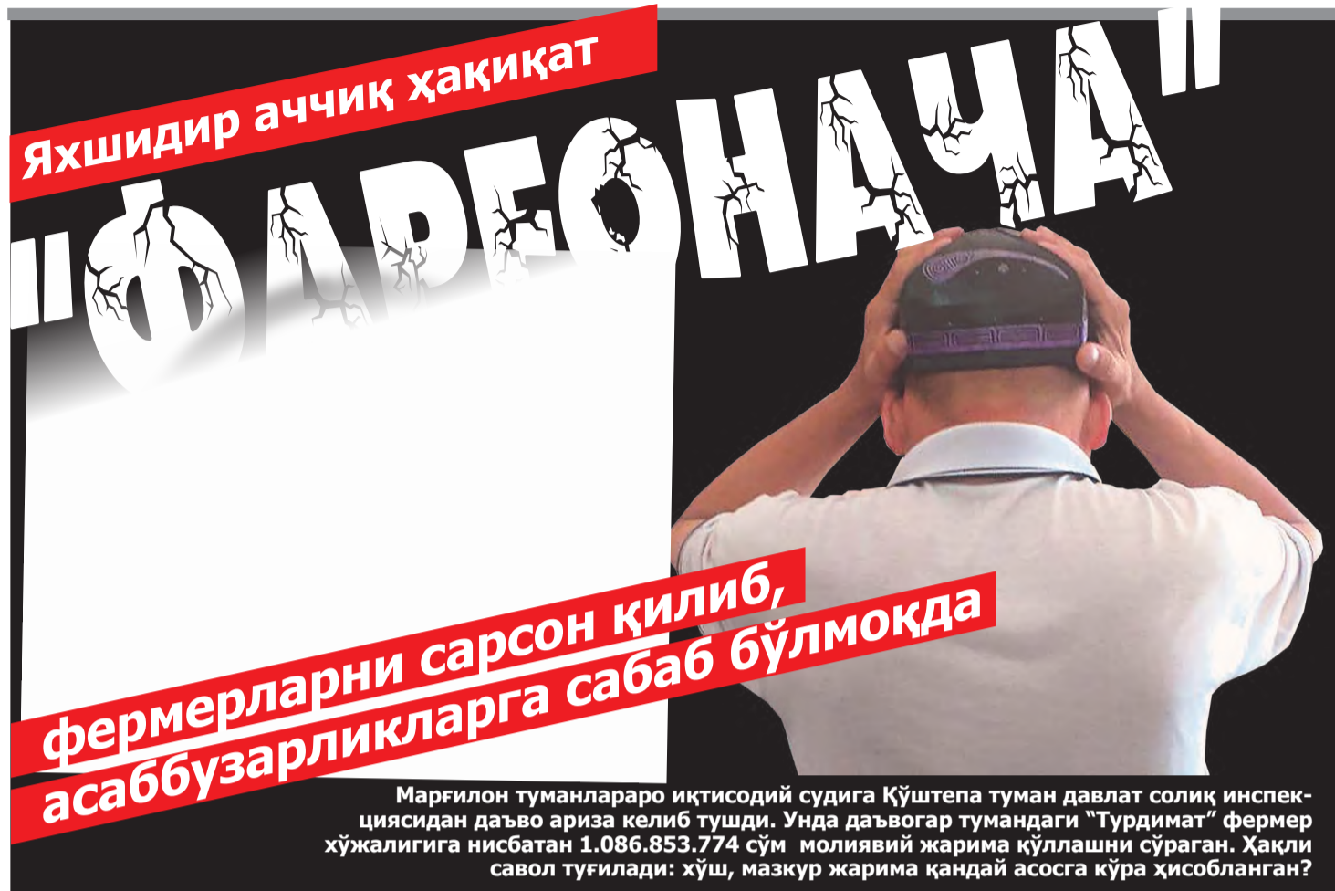
Марғилон туманларо иқтисодий судига Қўштепа туман давлат солиқ инспекциясидан даъво ариза келиб тушди. Унда даъвогар тумандаги "Турдимат" фермер хўжалигига нисбатан 1.086.853.774 сўм молиявий жарима қўллашни сўраган. Ҳақли савол туғилади: хўш, мазкур жарима қандай асосга кўра ҳисобланган?