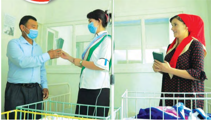
Фарғона шаҳрининг "Хўжамағиз" МФЙда яшовчи Одиловлар оиласида бирданига 4 нафар чақалоқ дунёга келди.

Бу оилада 2016 ва 2018 йилларда ҳам қиз фарзандлар туғилган. Эндиликда Ғанижон ва Мунаввархон Одиловлар оиласида 6 нафар фарзанд тарбияланмоқда. — Яхши ният билан тўрт нафар эгизак фарзандларимизга Тўлқинбой, Абдукарим, Абдуҳаким ва Зилола исмларини қўйдик, — дейди бахтли оила соҳибиди. — Келажақда болаларимизни элу юрт корига ярайдиган инсонлар қилиб тарбиялашга ҳаракат қиламиз.