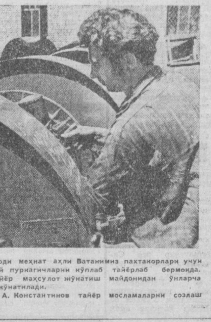
«Ташхисельмаш» заводини меҳнат аҳли Ватанимиз пахтазорлари учун ОБХ.14 маршали қимбўйи гуракичларни қўлаб тайёрлаб бермоқда.

Ўзбекистон ССРда 1974 йилда «Пул-буюм ютуқлари лотереяси» ўтказишни шартлари ва тартиби тўғрисида» тадбирлар белгилади.