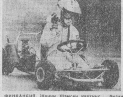
ФИНЛАНДИЯ. Женни Жамсон картининг билан бундан иккинчи йил муқаддам, эндиғина 3 беш йилгирада шугуллана бошлаганди. От-онларини эса берган машинада бошир йилгича спортнинг бу тури бўйича билалар муносабатида «каттиқ» тайёрлана бошлар. Маня эндиғина Женни картининг жуذا яхши бонзарлати (суратда). У челипон бўла оларимнинг. Бу саовл от-онларини ҳаммадан кўп ташвишланитарпти.

НЬО-ЙОРК. (ТАСС). Маҳаллий сиёсий ку-АКШнинг Гинч океандеги қуролли кучлари қўмондонини адмирал Н. Гейлдер. Американинг Таиланддаги қўшинлари бўйича ёрдамчиси Г. Кисселевнинг яқинда Хитойга қилдиган сарфари билан боғлиқмоқдалар.