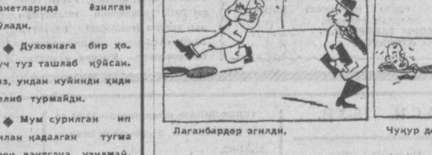
Лаганбардор эғилди... Чучур домга ялдинди...