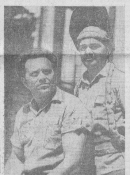
«Средатранстрой» трести 194-қурилиш монтаж поездининг азамат бунёдкорлари шахримизнинг турли объектларига гайрат билан меҳнат қилишмоқда.

Кўрғазма тўққизинчи беш йилликда республика халқ хўжалигидаги техника тараққиётини ривожлантиришга олимларнинг қўшаётган ҳиссаси ҳақида хўш хабар қилади.