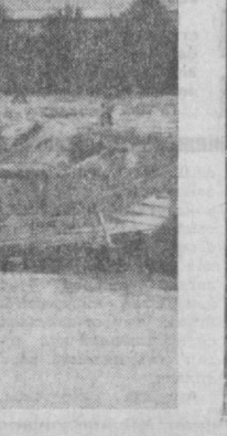
С. СУРАТДА: омонат, допилаб турган кўприкни қўриб туришмиз.

Биринчи «Қорақамш» массиви билан А. Набиев маҳалласини Қичирчиқ деб номланган анҳор ажратиб туради. Анҳорнинг ша-қари қилина қасалхонаси олдинда окувчи жойига кўприк ўрнатилган. Кўприкнинг иши томонини сув ялаб, у илприқдаги ёшда омонат бўлиб қолган. Бирой атроф маҳалладаги бо-лалар қариялар, аёллар-барча одамлар шу жойдан ўтишга маж-бур. Чунки чқин атрофда кўприк йўқ. Тўғри, анҳорга янги бетон