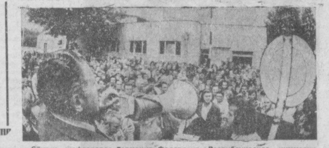
Сўнги ҳафтalarda Германия Федератив Республикасига қимматчиликнинг тўхтовисиз эсиб бориши муносабати билан еттич ва иш таъиниқлар янда давм олиб кетди. СУРАТДА: Гельзенкирхен шаҳридаги «АЗГ» концерни «Кюпперсбуш» электр инжозлар заводининг иш тўрлаган ишчилари.