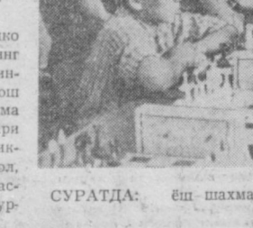
СУРАТДА: ёш шахматчилар мусобақаси.

Команда ҳисобида 141 очко тўплаган Тошкент шаҳрининг терма коллективи биринчи ўрин-ни эгаллади. Шундай қилиб бош совриш—спартакиаданинг Кўма кубогини пойтахт ўқувчилари қўлга киритдилар. Тошкентлик-лар спартакиаданинг волейбол, футбол, шахмат, кўл тўпи, бас-кетбол, қиличбозлик ва бн тур-ларида галиб чиқинди.