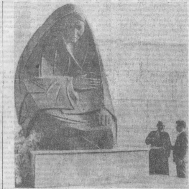
Уруш қанчадан-қанча онларининг бахтига чанг солди. Қанчадан-қанча аjoyиб фарзандларимиз, акаларимиз, оталаримиз уруш қурбон бўлди. Қанча онлар етим қолди. Лекин Ватан учун жонини қурбон қилганларнинг номин унутилмайди.

Немис фашист армиясини тор-мор келтиришда Тошкент шаҳри меҳнаткашлари ва илг'ам муносиб ҳисоси бор. Ватанга, армияга қатта мадад бўлишда шаҳримизнинг аjoyиб ўғиллари Улуғ Ватан урушининг Баренд ден, тивидан Корадевицага, булдан баъча фронтлариди душманга напшигаги зарбилар бердилар.