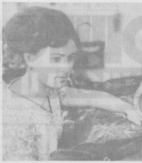
Бадий буюмлар фабрикасининг пешқадим тикувчиси, комсомол-ш...