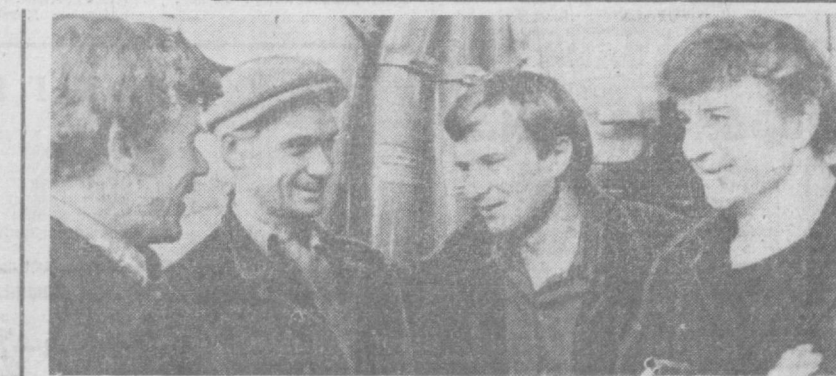
Воронцов оғли «Ташсельмаш» заводи коллективи ишлаб чиқарётган пахта терим машиналари ўзбекистон пахтачиларининг олдинги енгил қилди...