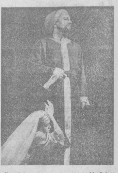
Улуғ ўзбек олими ва гуманисти Абу Райҳон Берунийнинг миғ йиллиги юқиндагина нишонланди.

МАДХУШУЛАЛАН САККИЗЛИК Муҳаббатим, сенсан шаробин манзим.