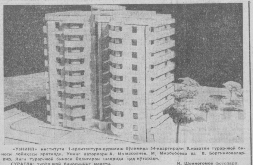
«УЗНИИП» институти 1-архитектура-қурилиш бўлимида 54-квартирали 9-қаватли турар-жой биноси лойиҳаси яратилди...