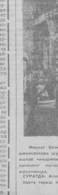
Меҳнат Қизил Байроқ орденин Ворошилов номдаги «Ташсельмаш» заводининг азамат машинасозлари шу кунларда олти қаторлик ХН-3,6 маркали пахта терш комбайнларини кўплаб ишлаб чиқармоқда. Корхона 22-қаватини Владимир йиғирмоқ бошқилиқ қилмоғчида солаш участкасининг ишчилари ҳар куни пландаги 7 пахта терш машинаси ўрнига 8 машинани тайёрлаб кўндалмоқда.

Шу кунларда Ленин район ободлаштириш бошқармаси азаматлари, ирригация хизматчилари районларининг янада обод бўлиши кўйла меҳнат қилинган. Қўш фақтда 40 миңг туғ турин мева манзарали дарахат кўчатлари, 58 миңг туғ яшил қўсқилар энчи планлаштирилган.