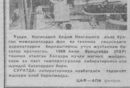
Узоро Иттисоий Ердан Кенгашига аъзо бўлган мамлакатлардан фан ва техника соҳасидаги ҳаракатларини бирлаштириш учун мустақим базалар яратилган...