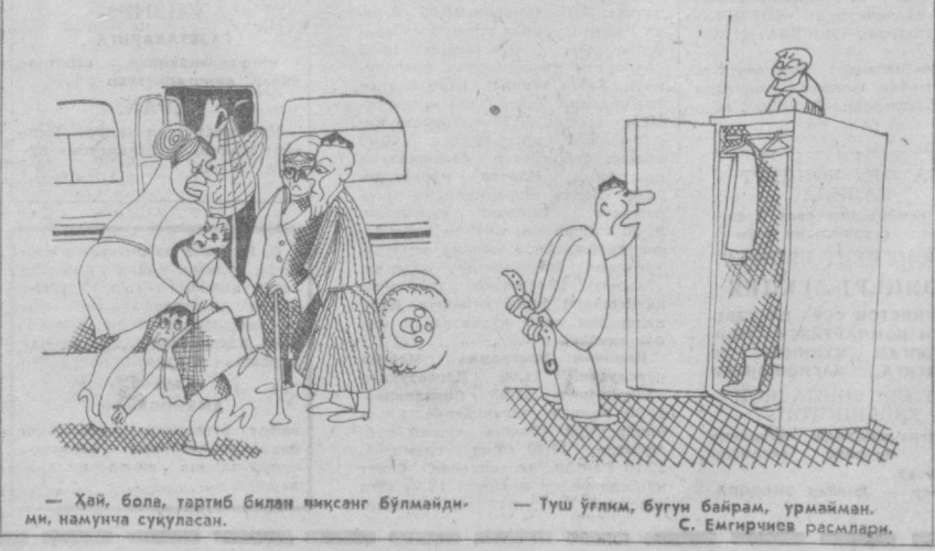
— Ҳай, бола, тарти билан қиссанг бўлмайди-ми, намуначи суқулсан. — Туш ўлким, бугун байрам, урмаймэн. С. Емгирчиёв расмлари.