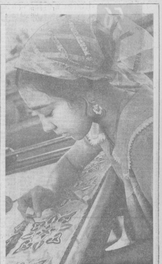
«Инақари тиллодан».

Шаҳар кинолаштринш бошқармаси Улуғ Октябрь социалистик революциясининг 56 йиллиги муносабати билан пролетариатнинг улуғ доҳийси В. И. Ленин ва Октябрь революцияси ҳақидаги бадий ва ҳужжати филмлар кинофестивалини ўтказмоқда. Пойтахт кинотеатрларида «Ленин Октябрьда», «Аср бошида», «Ленин Польшада», «Кремль курантлари» каби бадий филмлар кўрсатилмақда. Бундан ташқари, шаҳарнинг Ленин номи, Беруний, Навоий театри, Оқтепа, Калинин, Куйбисев номи, Бешқарағач, Революция хиёбонида жами 13 та кино установка ташкил қилindi. Уларда «Қизил майдон», «Ленин Қозонда», «В. Ульянов», «Ленин иш яшайди ва галаба қилади» каби ҳужжати филмлар намойиш этилмақда. Шаҳар маданият бошқармаси коллективи ҳам меҳнатқашларга маданий хизмат кўрсатиш мақсадида махсус концерт бригадаларини тўзди. Навоий, Оқушбо-ев, Х. Олимжон, А. Кахгор, У. Юсупов, Гилэр номи ва бошқа бир қатор маданият уйларининг бадий хаваскорлари майдонларда охиқ концертлар бермоқдалар. Улар ўз қушиқлари ва реқслари билан бахтёр замонамизни куйламоқдалар. Байрам шодибоналари давом этимоқда.