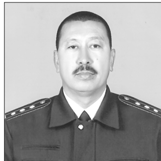
Темирханов Айтбай Жаксимович – Қорақалпоғистон Республикаси Ички ишлар вазири ўринбосари – Тергов бошқармаси бошлиғи