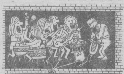
Асанбалта янги «ашулачи» келди.

Хоким йўқ — ўрига қинна, кўчирди, Мол ҳам — ўрига манжа салом. Қақаҳ ҳам ичимае, ўйда неирни — Тутатиб, фалақдан излашган панох. Дарё паст-қақшайди чирингиринг зори; Ер қаттиқ-татайлаб шиллар тирноқ, Эртмай эриган тоғларинг қори, Теришлар турарди чуқларда туңроқ. Амьрининг ҳос оши, ҳоннинг ҳос оши, Қўнчига минг бошич хирмонда ҳозир. Вақовул, ясовул, қозн, мингбоши, Камбағал худога ишгани ёзир? Бирин қатл эдилар, бирин оқдилар, Қўнчқин қилдилар даштга бадарга, Биринга «қуфр» деб тамга босдилар, Қўнчилар кўзини чуқиди қарга. Шунда мен чирқиллаб келдим одамга Қурраини шунақа дардчил жойида. Тарихлар сингиб Буюк Одамга, Бир нажот изларди ҳонни пойида.