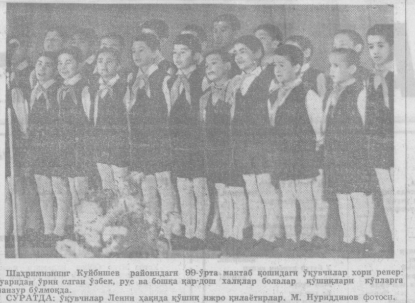
Шаҳриянинг Куйбишев районидан 99-ўрта мактаб қошидаги ўқувчилар хорн репертуарида ўри сган ўзбек, рус ва бошқа қар-дош халқлар болалар қўшиқларини кўндал-кўл маъна бўлмоқда.

СУРАТДА: ўқувчилар Ленини ҳақида қўшиқ ижро қилаётирлар.