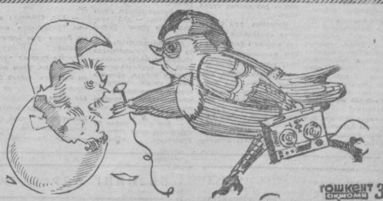
ИЖОДИИ РЕЖАЛАРИНГ ИЗ ҲАҚИДА БИР ИККИ ОГИЗ СЎЗЛАБ БЕРСАНГИЗ... М. Битшиев расми. 10 ДЕКАБРЬ, 1973 Я.