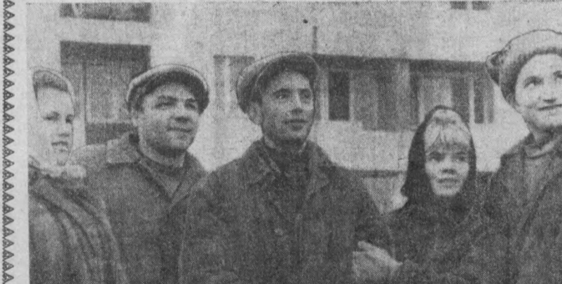
Кўн, кеча шахримизнинг Пушкин кўчасидаги «Марказ-2» минорайонини бунёд этаятган «Главмосстрой» курувчилари 40 ва 90 нартралаи уч турар, мой бноснони фойдаланишга топширдилар. Ҳозир бу мухташам уйларга ўнлаб тошкентлик меҳнатнашларнинг оналари кўнб ивара бошладилар. Кўп ўтмай яна икми уй фойдаланишга топширилади.

Ўзбекистон ремонт ишлаб чиқариш бош бошқармасига қўлаб корхоналар қарайди. КПСС Марказий Комитети ва СССР Министрлар Советининг ўтган йил 26 сентябрда «Совет халқининг фаровонлигини ошириш тадбирлари тўғрисида» қабул қилган қарори янги. 1968 йилдан бошлаб нунча кириши муносабати билан бу корхоналардаги қўлгана ишчиларнинг иш ҳақлари ҳам бирмунча ортди.