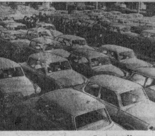
Германия Демократик Республикаси. Корхонада тайёрланган «Гранбант» унинг дарвозаси олдига фақат бир неча соатгина маҳтал бўлиб туради. Цинкнаудаги (Карл Маркс штати ирчути) автомобиль заводи ўзи тайёрлаган шундай машиналарини чет элларга, мулладан Болгария, Польша, Чехослования ва Финляндияга кўнрақ чиқарилади. Бу машинага ГДРнинг ўзида ҳам талаб ната.

«Асвон тўғон араб халқларини ва бутун дундаги озоқлик кўнрақларининг написталигини систематик қарши олиб бораётган курашда улар ўртасида бўлган ҳамкорлигининг ифодаси бўлиб келди ва шундай бўлиб қолади», деб таъкидлайди «Асавра ал арабий» газетаси.