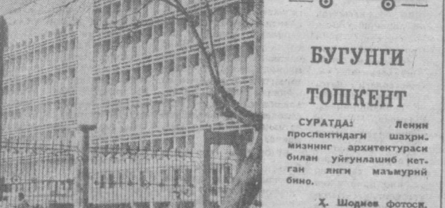
СУРАТДА: Ленин проспектдаги шахр. Минининг архитектура...