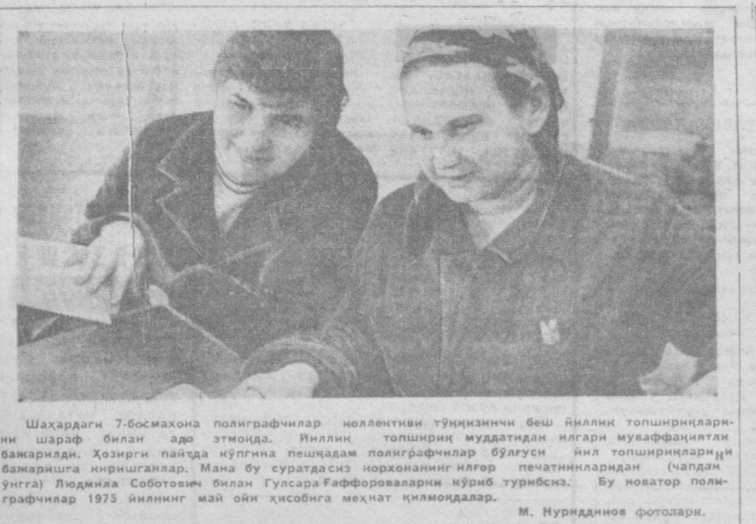
Шаҳардаги 7-босмахона полиграфчилар коллективини...