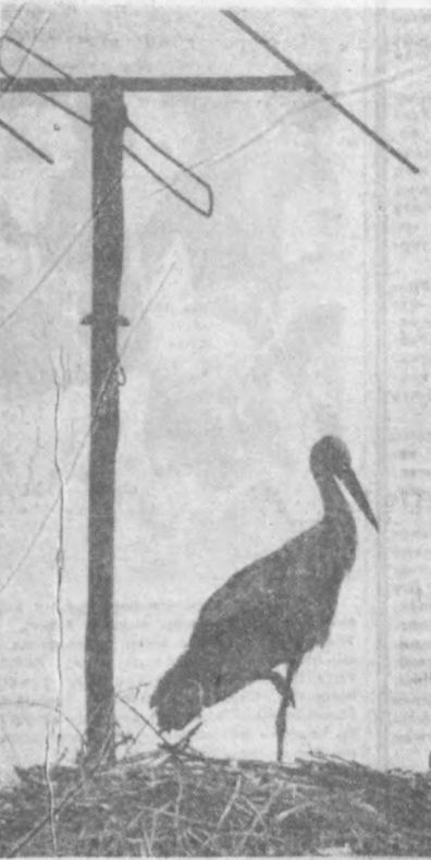
ЛАЙЛАК ВА АНТЕННА.