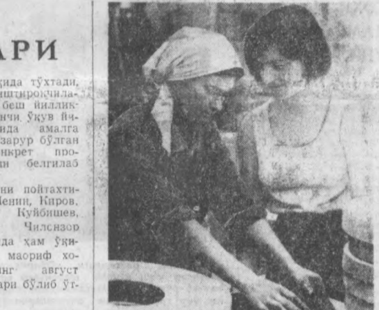
Август кенгашлари вақтида мактаб ўқитувчилари ва оқувчилари билан мулоқот қилишган.