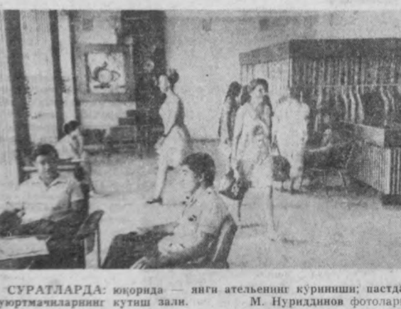
СУРАТЛАРДА: юқорида — янги ательенинг кўриниши; пастда — бюртмачиларнинг кутиш зали.