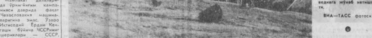
Лаос ватанпарварлари сўз кичларини қўшларига сезилари зарба беришни давом эттира-явтулар. Душман, айниқса Кўзлар Водийси—Сенкуангда катта талафот қўрди.

Шу билан бирга Бош секретари мамлакатда душман кўпурчилик фаолиятини тўхтатиб галлигини айтиб ўтди. Душман халқ кўчлари тарafdорларининг сарфиди ҳар бир заиф жойдан фойдаланмоқда. Душманларнинг кирдан-корларни тор-мор қилмоқ учун, деди Луис Корвалан, аввало иттизомни, барча халқ кучларининг жағовар руҳини мустақамламоқ зарур.