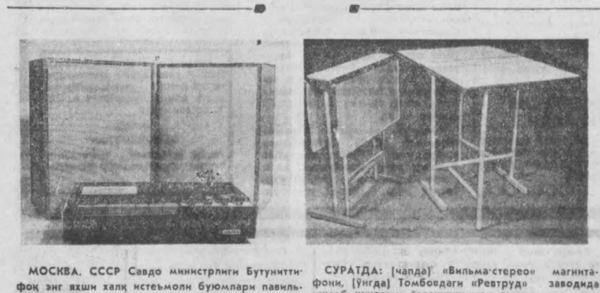
МОСКВА. СССР Савдо министрлиги Бутунитти-фок энг яхши халқ истеъмоли буюмлари павильонини экспериментал совети бир қатор халқ истеъмоли буюмларини ишлаб чиқаришни тасдиқлади.

СУРАТДА: [Чалда] «Вильма-стерео» магнитофон, [Унда] Томбодеги «Ревтруд» заводда ишлаб чиқариш ўлаштирилган тахнадаги ошхона столи.