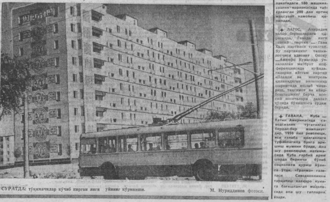
СУРАТДА: тўқимачилар қўчиб кирган янги уйнинг қўрилиши.

ГАВАНА, Куба — Латин Америкасида саводхонликни тугатилган бирдан-бир мамлакатдир. 1959 йил революцияси галаба қилганлиги тўғрисида бунга эришиш мумкин бўлди. Ана шу революция натижасида Куба гарбий яришларда биринчи бўлиб социализм куриш йўлига ўтди. «Гранма» газетаси Саводхонликни тарғибли халқаро кунига бағишланган мақолада ана шу гапларни ёзди.