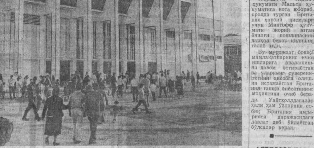
ДАМАШҚ. Бу ерда очилган халқаро Дамашк ярмаркасида, 26 давлат ва 17 чет эл фирмалари иштирок этадилди. Совет Иттифоқи бу ярмаркада 1954 йилдан бери иштирок этади. СССР павильонининг бу йилги экспозициялари сатҳи 2300 квадрат метр бўлган павильонда ва 1360 квадрат метр очик майдонда жойлаштирилган. СУРАТДА: Дамашқ халқаро ярмаркасидаги Совет павильони.

Эски фотографиялар Урта Осиёда Совет хо-лқияти нималардан бошланганини эслаш-га ёрдам беради. Уш-бу ҳақида ҳикоя қилувчи кинообъектлар Урта Осиё республикаларининг бу-ғунги ҳаётини тасви-ролаш ҳам унутгани йўқ.