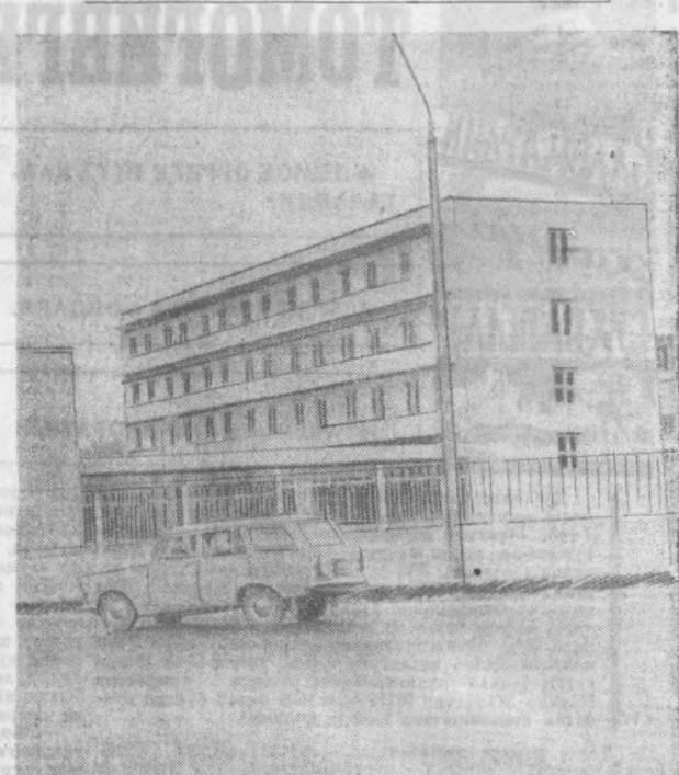
153-қурилиш трестининг 31-қурилиш бошқармаси коллективининг «Рассом» комбинатининг коллективни учун махсус ижодхона биносини қуриб берди. Чилонзор массивининг Гафур Гулом кўчасига ишлаган янги бино ҳақаматли бўлиб, унинг чехлари кенг ва ёруғ. Янги ижодхонада мўйилалар соҳиблари шаҳар майдонларини беэҳдибдан паннолар, катта плакатлар тайёрлайдилар. Айни пайтда