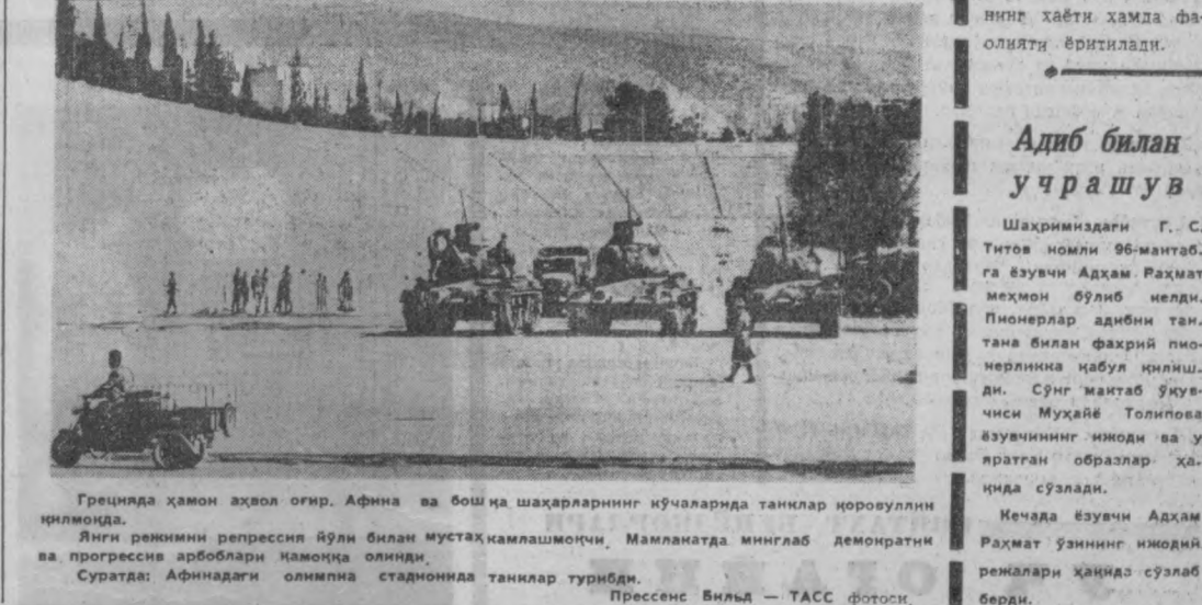
Грецияда ҳамон аҳвол оғир. Афина ва бошқа шаҳарларнинг кўчаларида танслар қоровуллик қилимоқда. Янги режими репрессия йўли билан мустаҳкамлашмоқчи. Мамлакатда минглаб демократик ва прогрессив арбоблар қамоққа олинди. Суратда: Афинадаги олимпик стадионда танслар турибди.