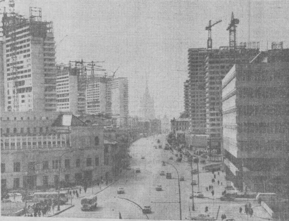
Москва шаҳрини реконструкция қилиш бош планининг архитекторлар тузган лойиҳаси турмушга татбиқ қилинмоқда. Янги вақтлар ичда Калинин проспектида пойтахтнинг янги чиройи — шинам, замонавий қилиб қурилган бинолар ансамбли барпо бўлади. Суратда: Калинин проспектидаги қурилишлар.

Кеча пойтахтдаги Тельман номидаги истироҳат боғида Куйбишев район меҳнатчилари Меҳнат ва революция ветеранларига шон-шарофлар мавзуда байрам ўтказдилар. Ойтабрий революциясининг 50 йиллигига бағишланган бу байрамни Куйбишев район партия комитети ҳамда меҳнатчилар депутатлари район Советининг иккинчи комитети биргаликда ўтказди.