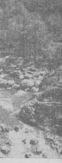
Тог кўйиндан шилдир-шилдир тушар сув, Дов-дарахта зумрад барглар табиб тушар у.