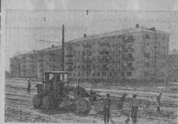
Чилонзорнинг энг янги минероайонларидан бири бўлган 25-минероайонда нег қўламада ободончилик ишлари олиб бориламоқда. Бугун-эрта эса асфальт ётирилганга Гафур Фулом кўчаси бўйлаб пассажир автобусларининг мунтазам қатнови бошланади.

Суратда: янги минероайонда кўчага асфальт ётирилмаёттир.