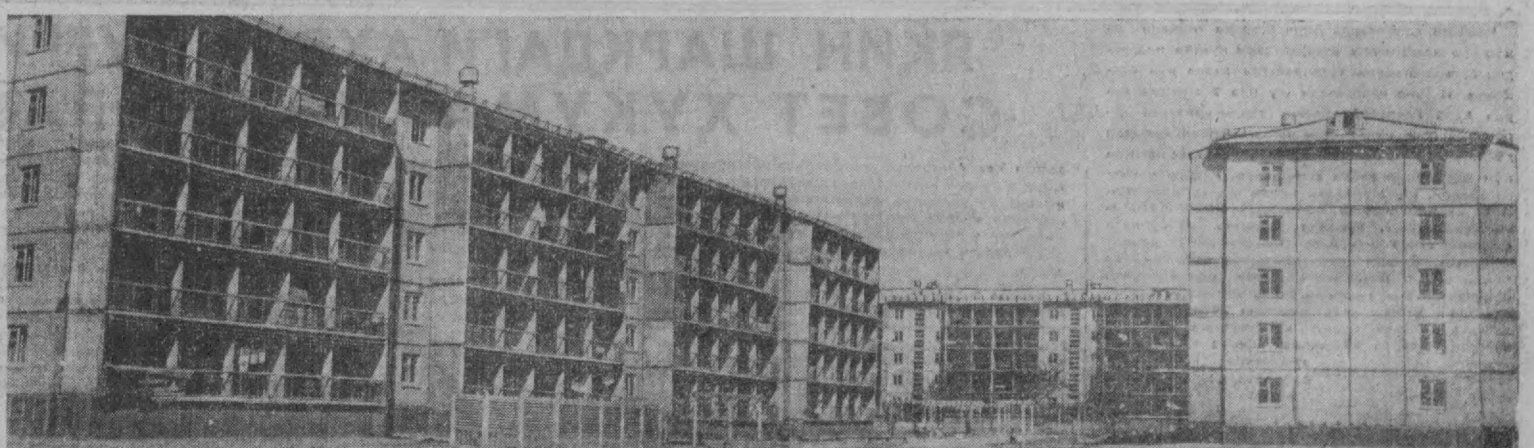
Навоий шаҳридан келган бинокорлар Тошкентдаги Қорақамш мас сивда 12 уйдан иборат квартал барпо этмоқдалар. Бу ерда мактаб ва қатор магазинлар ҳам қад кўтарди.— Суратда: навоийликлар барпо этган бинолар.

«Фан» нашриётининг аксарияти тайёр бўлди. Шонли юбилей йилида да босиб чиқарилган китоблари орасида улуг мутафаккир шоир Алишер Навоийга бағишланган асарлар ҳам энчагина бор. Шоир Алишер Навоий тугилган кунининг 525 йиллиги олдидан нашр этилаётган илмий тўпламларнинг