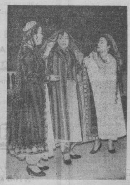
«Гулсара» операсидан кўриниш.

Дилдор кечқурун комбинезон олганига қарап кетган эди. Келса Шура уйдан ўздек отилиб чиқиб кетди. Унинг кўзлари қизарган, кўл йиғлаганидан бўлса қорак.