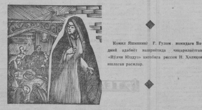
Комил Яшиннинг «Ғулум номидagi Бадний адабиёт нашриётида чиқарилаётган «Йўлчи Юлдуз» китобига расм Н. Ҳолиқов ишлаган расмлар.