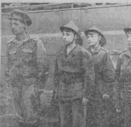
145-мактаб ўқувчилар ёш кўнгилди ўт учирувчилар дўстлигининг жашовар расъети.

Энгин чиқиб, унинг алаңгалари ҳамма ёққа тарқай бошлади. Бундан хабар топган ўт учирувчи тезда воқеа содир бўлди. Орадан роп-рос 11 секунд ўтган,