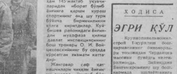
145-мактаб ўқувчилар ёш кўнгилди ўт учирувчилар дўстлигининг жашовар расъети.

у маҳсул ўт учириб сукудиги жойлашган балонини ишга солиб, хавфини бартараф қилди. Бу шикоятни ўт учирувчи Тошкентдаги 145-мактабнинг 5 синф ўқувчиси Жора Даниловдир.