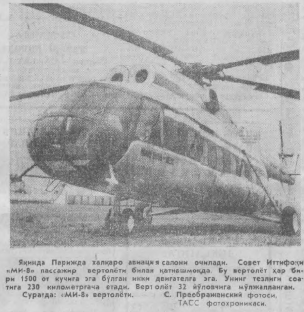
Яқинда Парижда халқаро авиация салони очилди. Совет Иттифоқи «Ми-8» пассажир вертолети билан танишмоқда...